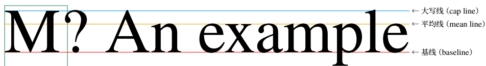
图 1：西文字体。绿色方框即为 em-box，它在纸上的实际边长就是西文字号。

在西文排版里，相邻两行 基线 (baseline) 之间的距离称为 行距 (leading, 发音为 led-ding)。这个词的词根是 lead，即 铅 。早在铅字时代，每当工匠填满一行铅字之后要开始填下一行，都会在两行之间插入铅条，从而适当地扩大行距。因为西文的每个字母四周与其 字框 (em-box, 见图 1) 之间有较大的空隙，所以不需要插入很高的铅条。一般来说，西文的行距为 字号 (font size) 的 1.2 至 1.45 倍 1 。