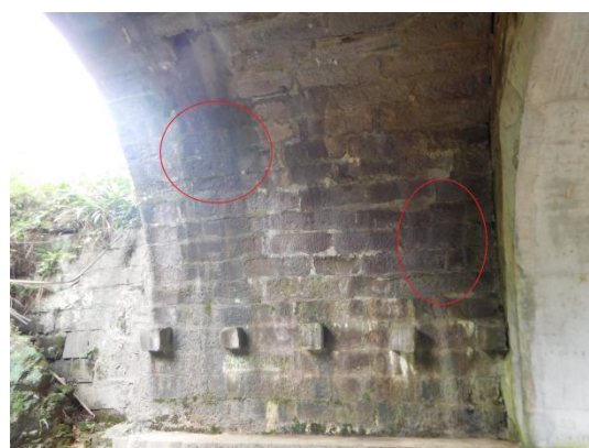
照片 5.1.1-2 左侧主拱圈渗水泛碱 (二)