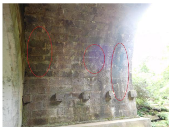
照片 5.1.1-1 左侧主拱圈渗水泛碱 (一)